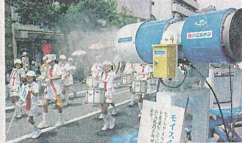
夏の屋外イベント会場で注目を集めている「モイスチャーミスト」=佐賀市の中央大通り

「ニシケン」がレンタルの器「マルチドライミスト」が注目を集めている。イベント会場などの暑さ対策として、細かい霧を空中に飛ばして冷却する仕組みで、県内でも使用実績が増えている。同社は「涼しい空間が広がる」